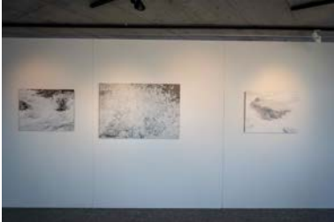
Werke von Werner Casty in der Ausstellung «Wasser-Raum» im Visitor Center