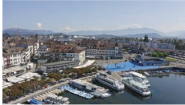
Kunstinstallation «Wasser-Raum» auf dem Fischmarktplatz Rapperswil von Flora Frommelt und Kevin Mikes