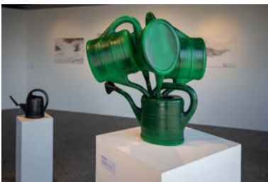
Werke von Zeno Schneider in der Ausstellung «Wasser-Raum» im Visitor Center