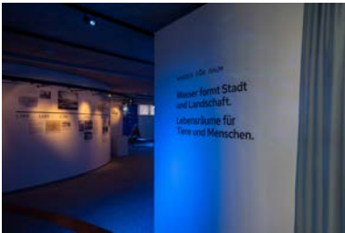
«Wasser-Raum», Ausstellung Visitor Center