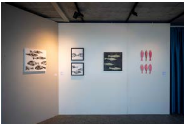
Werke von Sonja Lippuner in der Ausstellung «Wasser-Raum» im Visitor Center