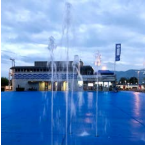
Kunstinstallation «Wasser-Raum» auf dem Fischmarktplatz Rapperswil von Flora Frommelt und Kevin Mikes