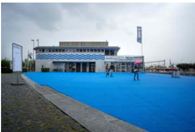
Kunstinstallation «Wasser-Raum» auf dem Fischmarktplatz Rapperswil von Flora Frommelt und Kevin Mikes