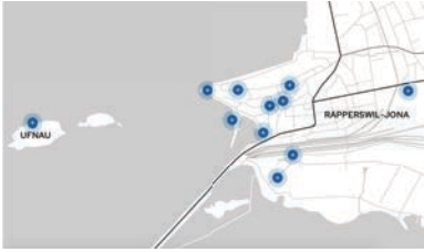
«Wasser» in Rapperswil-Jona entdecken: Museen, Ausstellungen, Brunnen und Kunstwerke im öffentlichen Raum